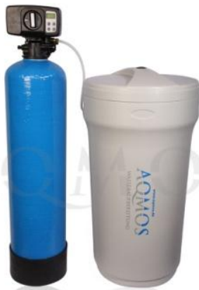
Abb. 1: Aqmos BMX-60