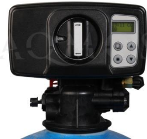
Abb.2: Steuerventil BNT 1650

GFK-Druckflasche, gefüllt mit hochwertigem Ionenaustauscherharz, PE-Solebehälter für einen Salzvorrat von max. 75kg, mengengesteuertes Zentralsteuerventil Typ BNT 1650, integriertes Feinverschneidungsventil, Absaugeinrichtung und Verbindungsleitung zum Zentralsteuerventil.